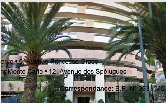
La Réserve • 5, Avenue Princesse Grace Fairmont Monte Carlo • 12, Avenue des Spélugues

3/4 pièces: 185m 2 + 56m 2 = 242m 2 . Entrée, wc, cuisine équipée, séjour, 2 chambres, 2 sdb, 2 dressings. 1 cave & 4 parkings. Hall d'entrée, cuisine équipée, séjour, salle à manger, 2 chambres, dressing, placards, 2 salles de douches, toilette invités, loggias. 1 Cave & 1 Parking.